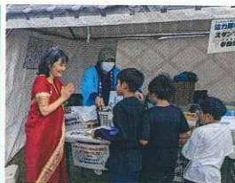
協力隊を探せ！スタンプラリー