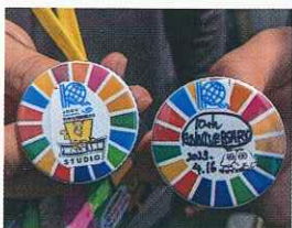
達成賞のオリジナル缶バッジ