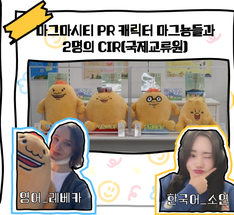
마그마시티 PR 캐릭터 마그농들과 2명의 CIR(국제교류원)