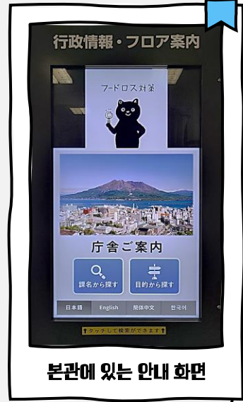
본관에 있는 안내 화면

또, 시청의 본관 입구로 들어오면 좌측에 행정정보와 층별 안내 스크린이 있습니다. 스크린을 터치하면 원하시는 창구를 찾을 수 있습니다. 안내 스크린은 영어, 중국어(간체자), 한국어 대응이 가능합니다. 외국어로 이용하실 경우 먼저 원하는 언어를 선택 후 검색해 주세요.