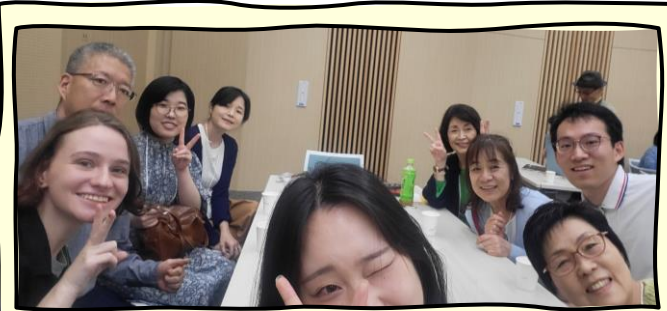
마지막 세션 팀원들과 사진 한 장!

국제교류카페란, 다양한 국적의 사람들과 일본인이 일본어나 영어 등의 언어로 교류하는 이벤트입니다. “아직 일본에 온 지 얼마 되지 않아 친구가 없는 분”이나 “새로운 사람과 이야기하고 싶은 분” 등 일본인이나 다른 외국인들과 교류하고 싶은 분에게 딱 맞는 이벤트라고 생각합니다.