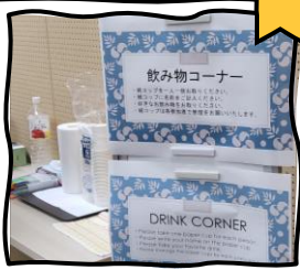
무료 음료 코너