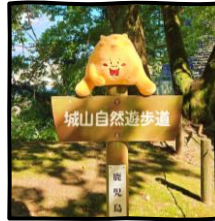
시로야마 자유 산책로 표시

해발 약 107m 높이의 시로 야마에서 사쿠라지마, 긴코만과 같은 웅장한 자연과 접해있는 가고시마의 도시 경관을 내려다볼 수 있습니다. 푸르른 자연을 느끼고 싶거나 아름다운 사진 스팟을 찾는 분에게 추천하는 곳입니다!