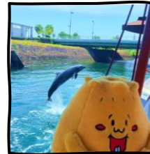
돌고래는 어디 있을까요?

※바다의 상황이나 돌고래의 컨디션 에 따라 변경 또는 중지되는 경우 있음