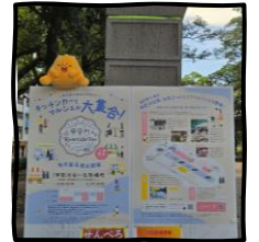
리버사이드 페스티벌 안내

또한, 봄에는 만개한 벚나 무가 있는 멋진 꽃놀이 장소이기도 합니다. 그 외에도 한 달에 한 번 주말에 열리는 리버사이드 페스티벌이나 봄가을에만 열리는 「나무시장」 등 다양한 이벤트가 열리는 곳이기도 하답니다!♪