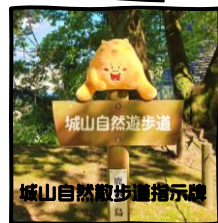
城山自然散步道指示牌